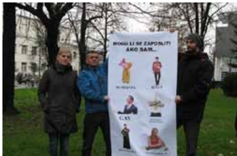
Akcija „Šta je to potrebno da ostvarim svoje pravo na rad?“ preko puta Narodne skupštine RS

Povodom 10. decembra – Međunarodnog dana ljudskih prava, UG „Oštra nula“ i Helsinški parlament građana iz Banjaluke održali su performans pod nazivom „Šta je to potrebno da ostvarim svoje pravo na rad?“