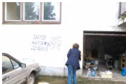
Akcija u Doboju povodom 10. decembra Koalicija Tolerantno

Tom prilikom su uklonjeni svi identifikovani grafiti sa uvredljivim sadržajem, kao i oni koji sadrže govor mržnje i fašističke simbole.