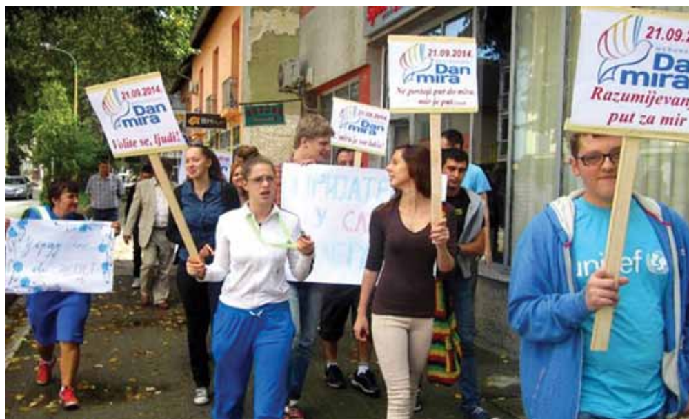
Obilježavanje Dana mira u Maglaju