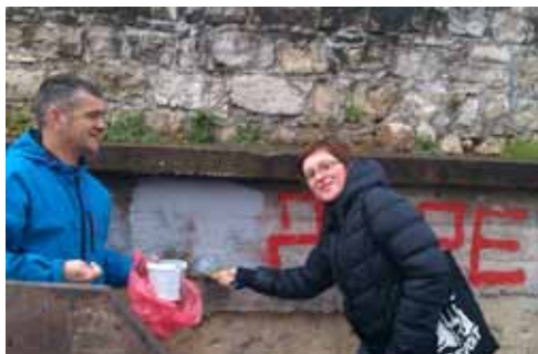
Foto: Akcija u Banjaluci povodom 10. decembra Helsinški parlament građana Banjaluka i Oštra Nula

Mreža za izgradnju mira, Helsinški parlament građana Banjaluka i Oštra Nula u Banjaluci organizovali su akciju čišćenja grafita fašističkog i šovinističkog sadržaja. Akciju je pokrenula Mreža za izgradnju mira pod nazivom Okrećimo grafite mržnje.