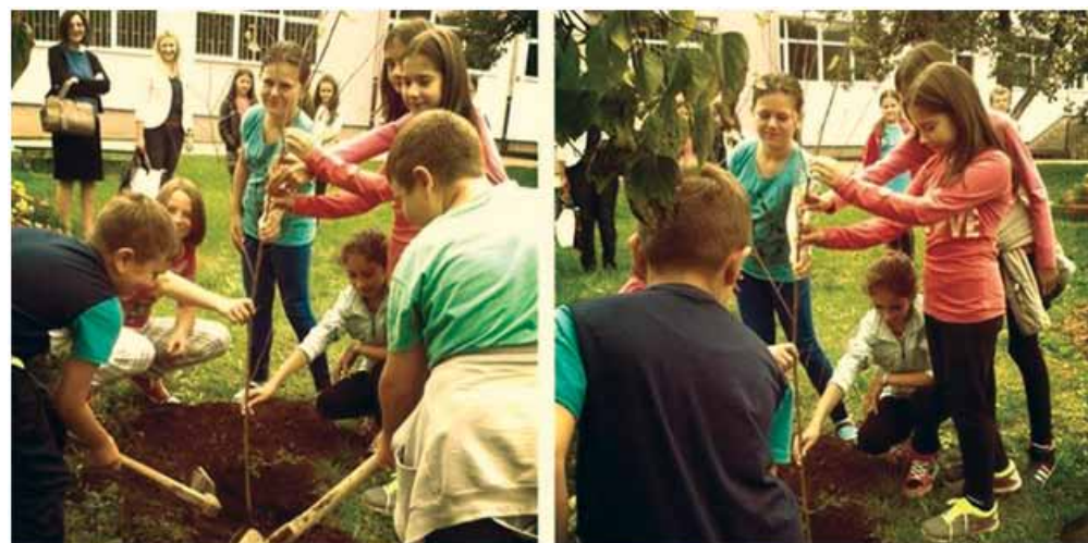
Foča i Foča u FBiH: U okviru projekta Pro-Budućnost mališani iz OŠ 'Ustikolina' i OŠ 'Sveti Sava' obilježili su Dan mira uz ples, pjesmu, sadnju drveća, kreativnu radionicu i igru s Pčelicom Majom i Pavom!