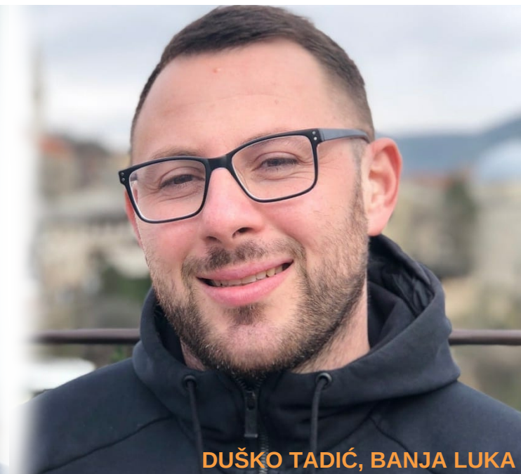
DUŠKO TADIĆ, BANJA LUKA